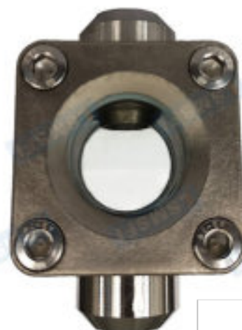
SG-ZT61-68 (conn. a saldare)