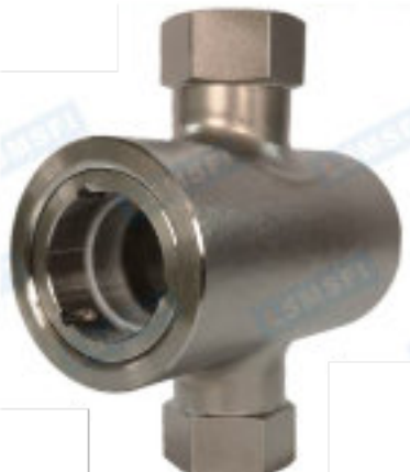
SG-ZT11-30 (fino a 100 bar)