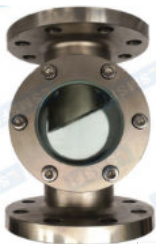
SG-ZT41-205D (gocc. obliquo)