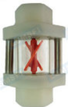
SG-YL11-057 (in PP)