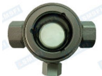
SG-ZT11-3W (3 connessioni)