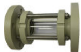
SGD (realizzabile in PVC/PP/PE/PVDF)