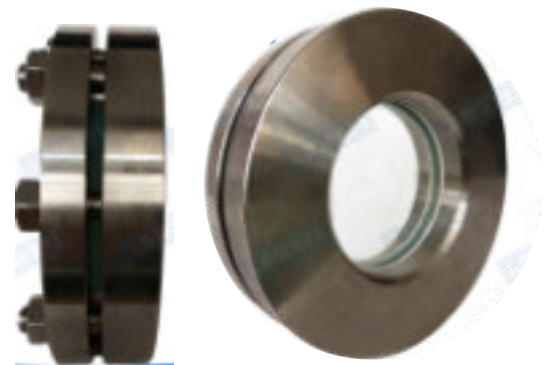
SG-002 (specola a saldare)