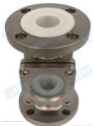
SG-ZT41-206P (rivestita in PTFE)