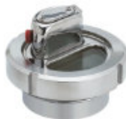
SIG05 (sanitaria con luce)