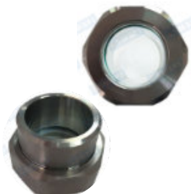
SG-001W (a saldare)